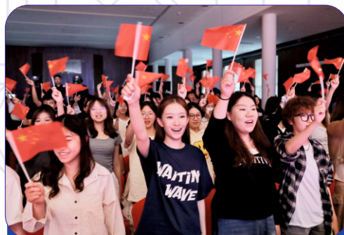
济南市（中国山东省，山东师范大学赫尔岑国际艺术学院）